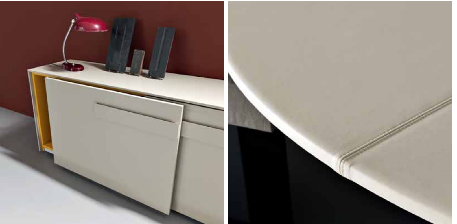
Made in Italy, a guarantee of excellence.